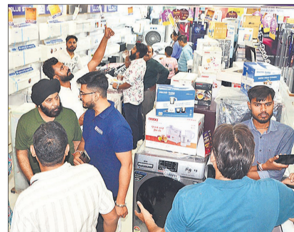
सिविल लाइंस में इलेक्ट्रॉनिक्स सामान की जमकर हुई बिक्री।

80 करोड़, किराना बाजार में 65 करोड़, कपड़ा बाजार में 70 करोड़, मिठाई और ड्राई फ्रूट्स