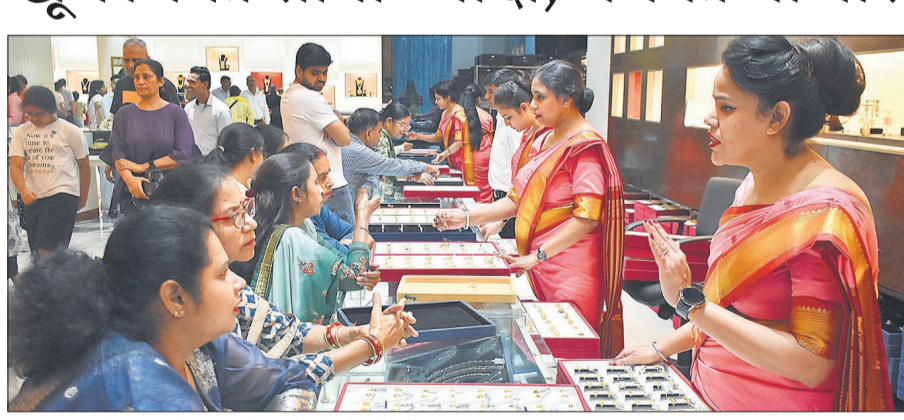
सर्किट हाउस रोड पर धनतेरस पर शोरूम में ज्वेलरी खरीदती महिलाएं।