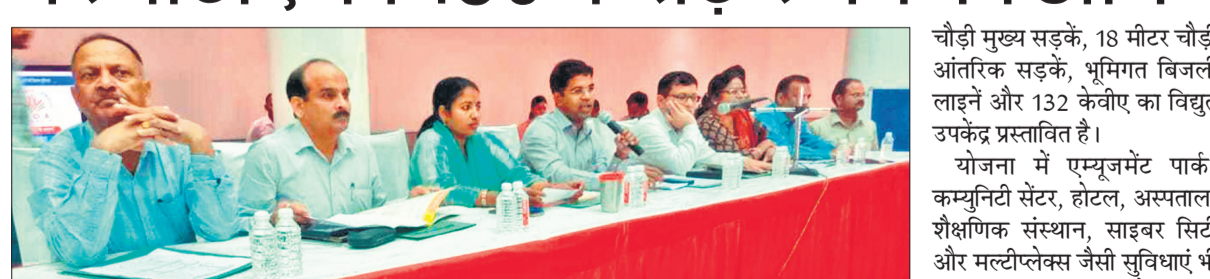
बीडीए कार्यालय में भूखंडों की लॉटरी के दौरान मौजूद अधिकारी।