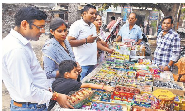
सुभाष नगर रेलवे ग्राउंड पर पटाखा बाजार में खरीदारी करते लोग।