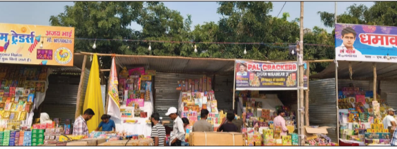
एमबी इंटर कॉलेज के मैदान पर लगी दुकानों के बीच नहीं कोई गैप।

बरेली, अमृत विचार : नगर मजिस्ट्रेट और एसपीएम द्वितीय की ओर से शहर में नए स्थानों पर लगाने वाले अस्थायी पटाखा बाजार के लिए लाइसेंस जारी करने के साथ दुकान लगाने की शर्त भी लागू की गई है लेकिन शर्तों का खुला उल्लंघन हो रहा है। एमबी इंटर कॉलेज के मैदान पर जो दुकानें लगाई गई हैं, उनमें एक मीटर का भी गैप नहीं दिया है जबकि नियमानुसार तीन मीटर का गैप देने के बाद ही दूसरी दुकान लगाई जानी चाहिए। इसके अलावा खुले में रखकर पटाखा बेचने पर प्रतिबंध है लेकिन खोलकर पटाखा बेचे जा रहे हैं। इतनी नहीं, सीएफओ की रिपोर्ट पर प्रशासन ने 30 दुकानें लगाने की अनुमति