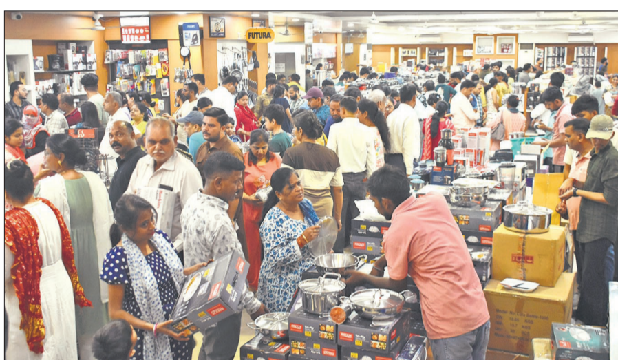
धनतेरस पर प्रेमनगर में एक दुकान पर बर्तन खरीदने के लिए उमड़े ग्राहक।

व्यापारियों के अनुसार धनतेरस पर सराफा बाजार में 500 करोड़, वाहन बाजार में 250 करोड़, इलेक्ट्रिक और इलेक्ट्रॉनिक्स बाजार में 100 करोड़, बर्तन बाजार में