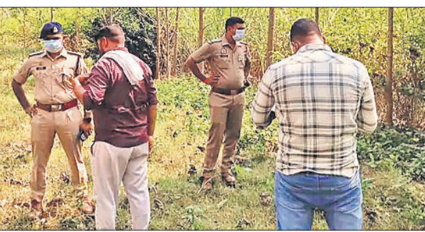
घटनास्थल पर जांच करती पुलिस।

सभी बरेली से ईको में सवार हुए थे। हादसे में