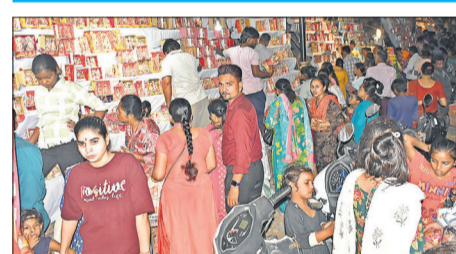
दिवाली पर पूजन के लिए मूर्तियां खरीदते ग्राहक।

ऑटो सेक्टर से जुड़े कारोबारियों का कहना है कि इस बार त्योहार पर बीते साल की तुलना में बिक्री में करीब 20 फीसदी वृद्धि की उम्मीद है। जीएसटी कम होने से दोपहिया वाहनों पर आठ से पंद्रह हजार रुपये व बड़े वाहनों की कीमतों में एक लाख तक की कमी आई है। इससे वाहनों की बिक्री में तेजी आई है। अकेले ऑटो सेक्टर से लगभग 250 करोड़ रुपये तक का व्यापार होने की उम्मीद है। टू-व्हीलर से लेकर हाई-एंड लजरी कारों तक की डिमांड काफी बढ़ी है।