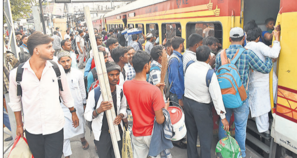
बरेली जंक्शन पर ट्रेनें में बढ़ने को मारामारी करते यात्री।