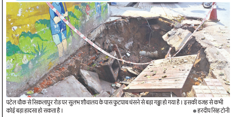
पटेल चौक से सिकलापुर रोड पर सुलभ शौचालय के पास फुटपाथ धंसने से बड़ा गड्ढा हो गया है। इसकी वजह से कभी कोई बड़ा हादसा हो सकता है।